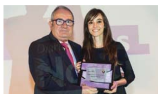
Diario de Noticias.