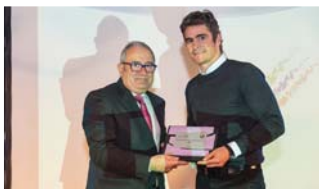
TID (Técnicas Industriales en Decoración).