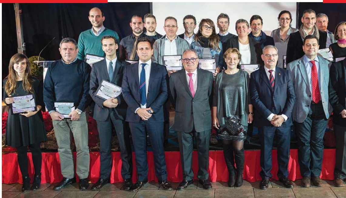
La Junta Directiva del C.A. Osasuna con los miembros de Honor de la Fundación.