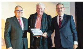
A.D. Veteranos C.A. Osasuna.