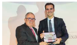
Obra social "la Caixa".