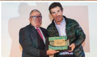
Restaurante Palacio Castillo de Gorraiz.