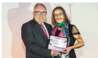
Diario de Navarra.