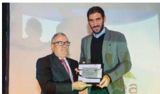
Centro Comercial La Morea.