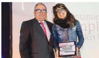
Ayuntamiento de Pamplona.