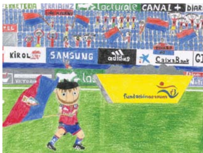
Javier Aramendía Echenique.