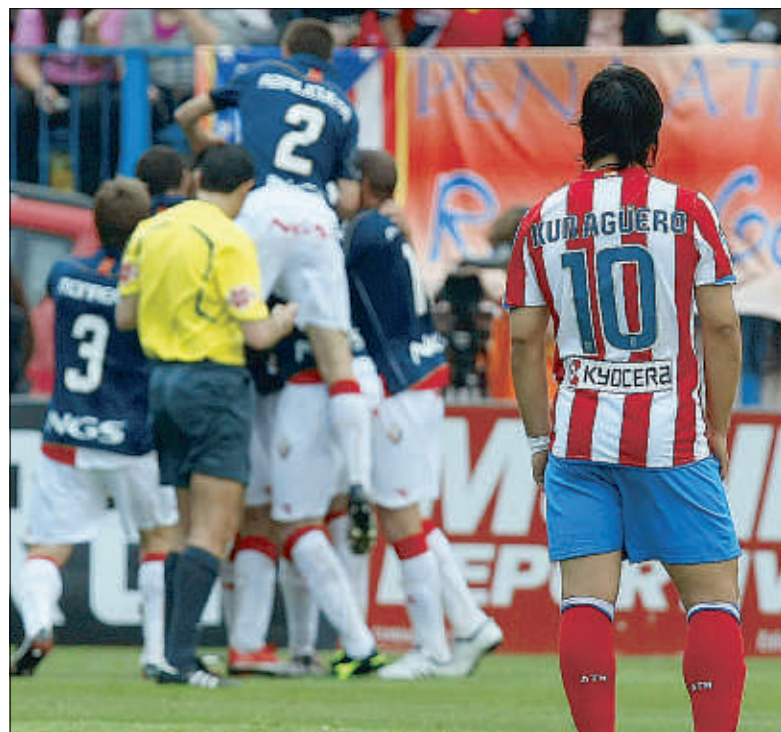
Osasuna venció sin problemas al Atlético de Madrid en el Vicente Calderón