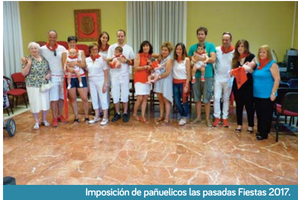
Imposición de pañuelicos las pasadas Fiestas 2017.

Éste será un momento muy emotivo para las familias que se acerquen para ser testigos de este acto. La Corporación les deseará que vivan las Fiestas de Allo con alegría, y como no puede ser de otra forma: de blanco y con el pañuelico rojo anudado al cuello.